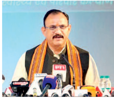
को इसकी सुविधा निशुल्क मिल सके इसके लिए हर जिला अस्पतालों में आईपीएचएल की

वाले दिनों के लिए बनाई गई कार्य योजना पर पत्रकारों से चर्चा की। उन्होंने कहा कि अक्सर गंभीर मरीजों के अस्पताल पहुंचाने में लगने वाला वक्त उनकी स्थिति को नाजुक बना देता है। आने वाले दिनों में 23 जिलों में क्रिटिकल केयर हेल्थ ब्लॉक्स बनाए जाएंगे। यहां मौजूद दक्ष स्टाफ गंभीर मरीजों को त्वरित इलाज की सुविधा देगा जिससे रोड एक्सीडेंट सहित अन्य मामलों होने वाली मृत्युदर में कमी आएगी। इन क्रिटिकल केयर में विषय विशेषज्ञ डाक्टरों के साथ अन्य चिकित्सकीय स्टाफ को तैनात किया जाएगा। स्वास्थ्य मंत्री ने कहा किसी बीमारी का पता लगाने पैथोलॉजी जांच महत्वपूर्ण होता है। लोगों