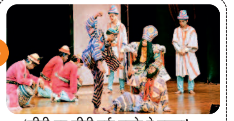
'सीढ़ी-दर-सीढ़ी उर्फ तुक्के पे तुक्का'....